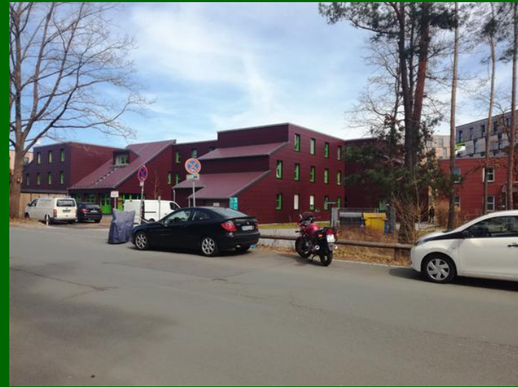
Studentski domovi South Campus-a